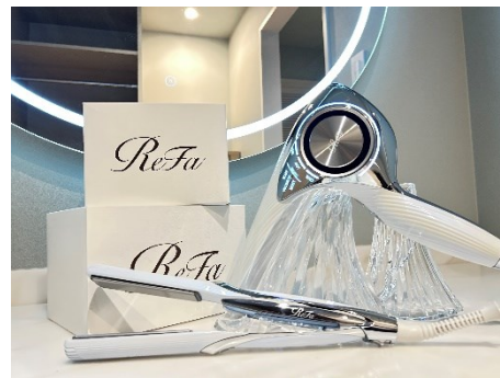
デラックスファミリールームは ReFa のドライヤーをご用意