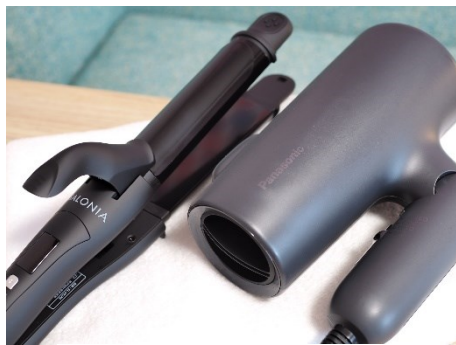
ヘアアイロンも全室常備

当ホテルでは、SDGs(持続可能な開発目標)の取り組みの一環として、プラスチック削減およびリサイクル促進を目的に、フロントに フリーアメニティコーナー を設置いたします。フリーアメニティコーナーには綿棒、コットン、ボディタオル、ヘアブラシ、ヘアゴム、カミソリ、ティーバッグをご用意しており、お客様には必要な分をお取りいただけます。この取り組みを通じて、使い捨てプラスチックの削減を進め、環境負荷の軽減に努めてまいります。