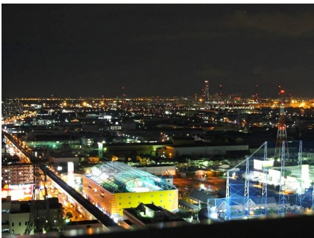
大阪ベイエリアの夜景

客室は 10 階から 19 階に位置しており、大阪ベイエリアやシティエリアの美しい夜景をご覧いただけます。エレベーターホールには旅行気分を盛り上げる壁画を設置いたしました。大阪をモチーフにしたアートで全 6 種類ございます。ご旅行の思い出にフォトスポットとしてもご利用ください。