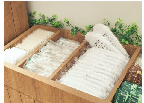
フリーアメニティコーナー