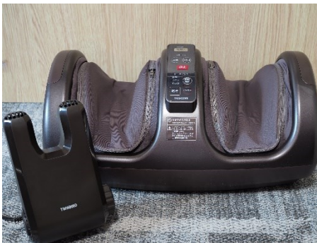
全室にフットマッサージャー、くつ乾燥機