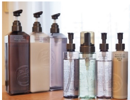
充実のアメニティ