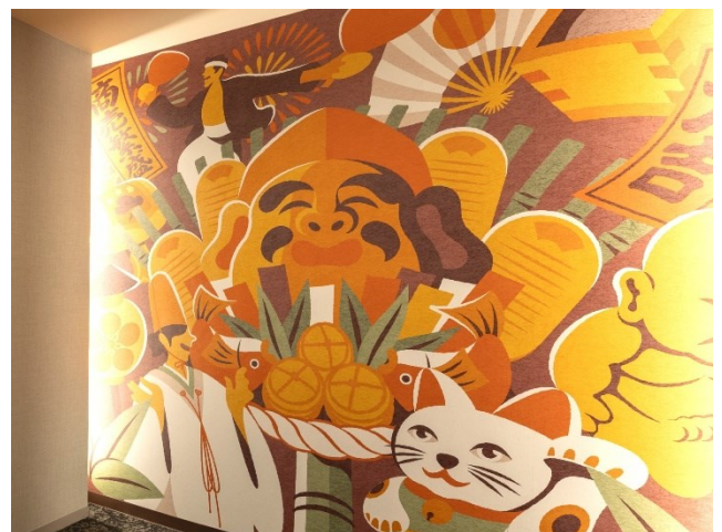
エレベーターホールの壁画